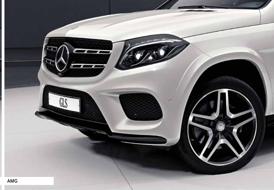
Багажные системы | AMG