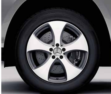
48,3 cm | 19" 03 04 48,3 cm | 19"