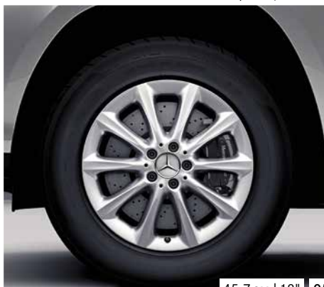
45,7 cm | 18" 05 06 45,7 cm | 18" 45,7 cm | 18" 07 08 45,7 cm | 18"