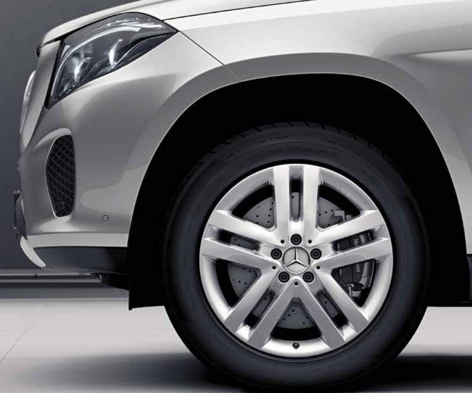
48,3 cm | 19" 01 48,3 cm | 19" 02